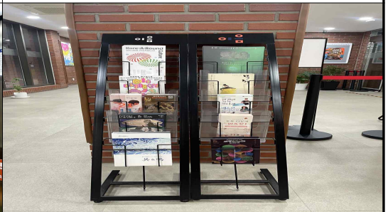
1층 홍보물 게시대