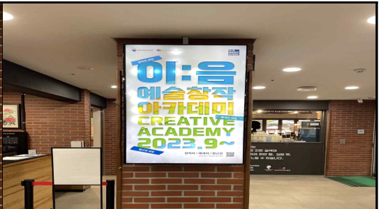
1층 모니터 2EA