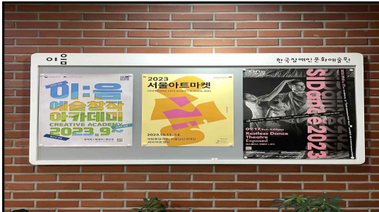
1층 게시판 2EA